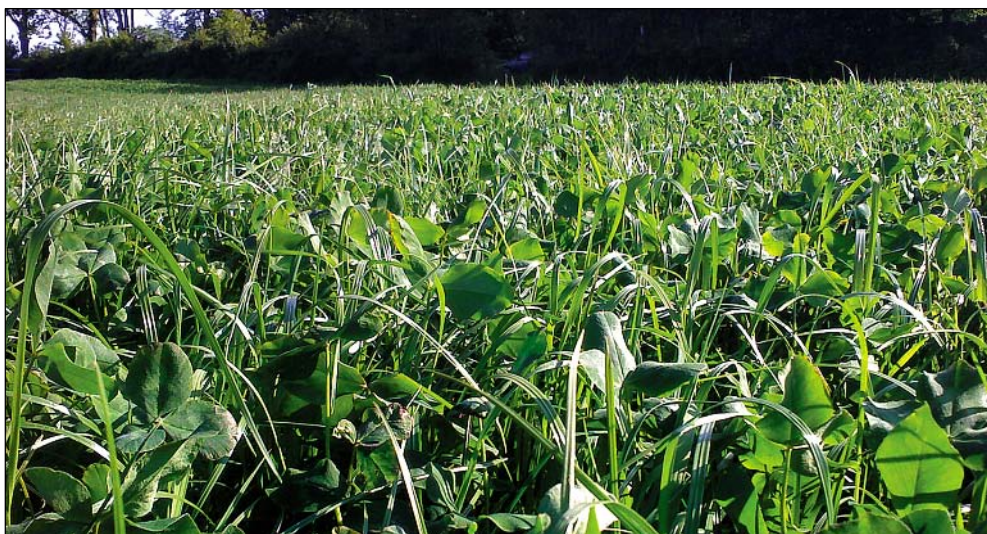
Rotklee gras auf dem Standort Ostenfeld zeigt noch keine Schnittrufe an. Diese ist erst bei ca. 30 % der Knospenbildung erreicht.

* Prognose mit Simulationsmodell der CAU Kiel, bearbeitet vom DWD Braunschweig