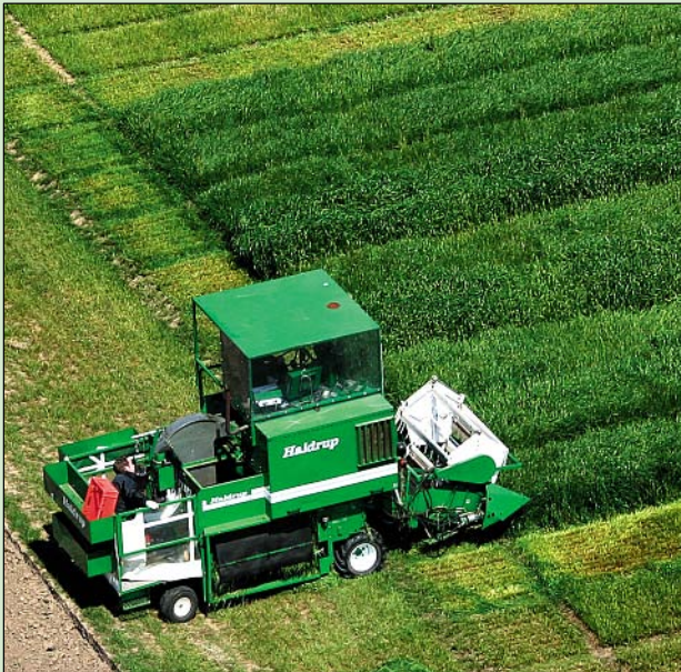
Auf den Versuchsfeldern der Landwirtschaftskammer herrscht in diesen Tagen beim Grünlandschnitt Hochbetrieb.