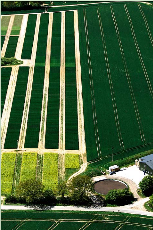
Die Getreideversuche freuen sich über die in den vergangenen Tagen gefallenen Niederschläge.