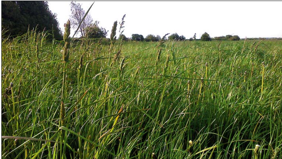
Niederungsflächen in der Eider-Treene-Sorge-Niederung mit Wiesenlieschgras und Rispenarten sind in diesem Jahr weitentwickelt. Teilweise sind die Bestände schon in die Heureife gelangt.