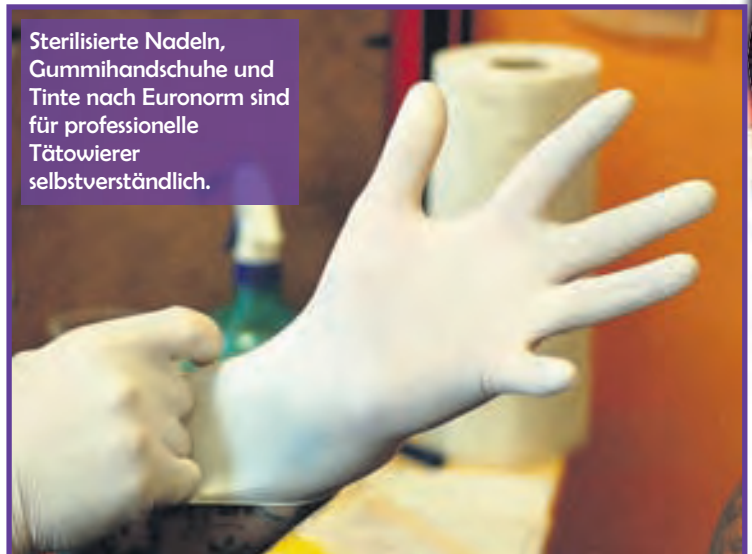
Sterilisierte Nadeln, Gummihandschuhe und Tinte nach Euronorm sind für professionelle Tätowierer selbstverständlich.

Wahnsinn durch den Kopf, und das ist ziemlich lange her. Dazwischen liegen wilde Zeiten, in denen er unter anderem mit einem Campingwagen die Mari-